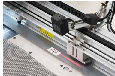
Tooling recognition (bar code) with automatic pattern selection

Reconocimiento de herramientas (código de barras) con selección automática de patrones