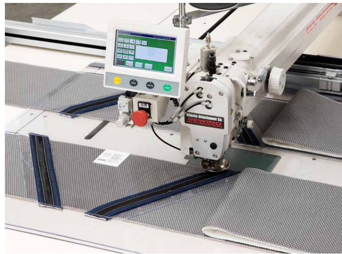
Touch screen operation Operación con pantalla táctil