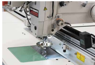
Well-designed machine with gear belt transmission of the sewing carriage for smooth, controlled, operation.

Reconocimiento de herramientas (código de barras) con selección automática de patrones