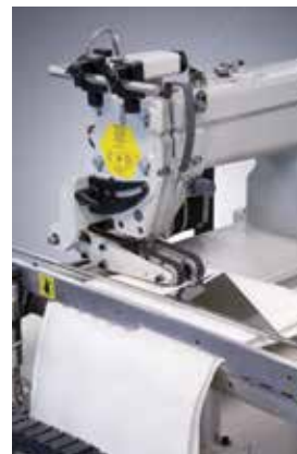
4300200 Closer (optional) Cerradora (opcional)