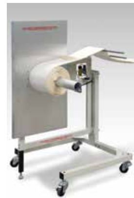
1330200 Rewinder (optional) Rebobinado (opcional)