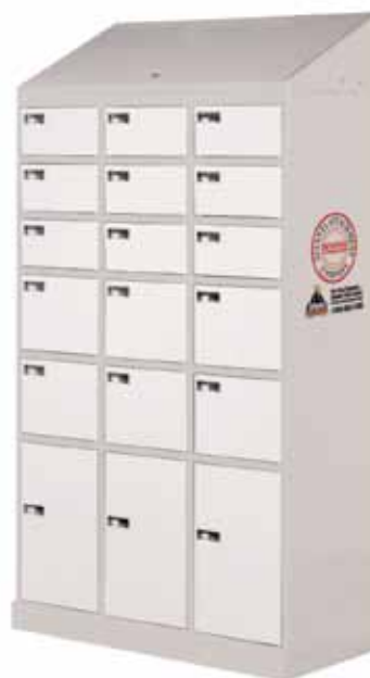
APS3 Parts and Equipment Locker

Mix and match any configuration with multiple units to fit the needs of your plant