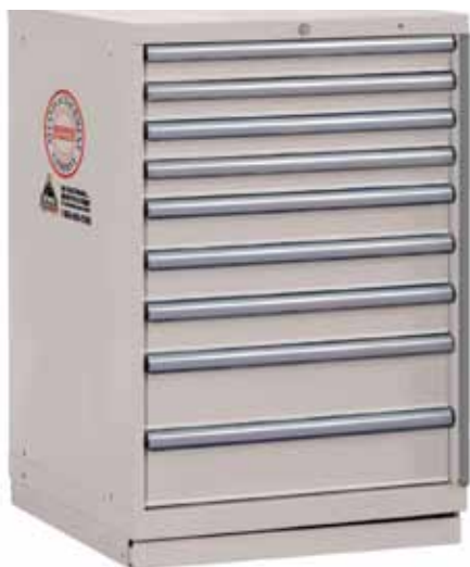
APS2 Parts Cabinet