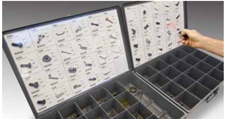
Scan the barcode associated with the item you are needing to re-order Escanee el código de barra asociado con las partes que necesita ordenar

Comuníquese con su representante de ventas para personalización de su sistema de escanear y ordenar