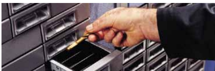
Drawer-based dispensing requires NO repackaging and does not drop items Dispensadores basados en cajones NO requiere re-empaque y no deja caer los componentes